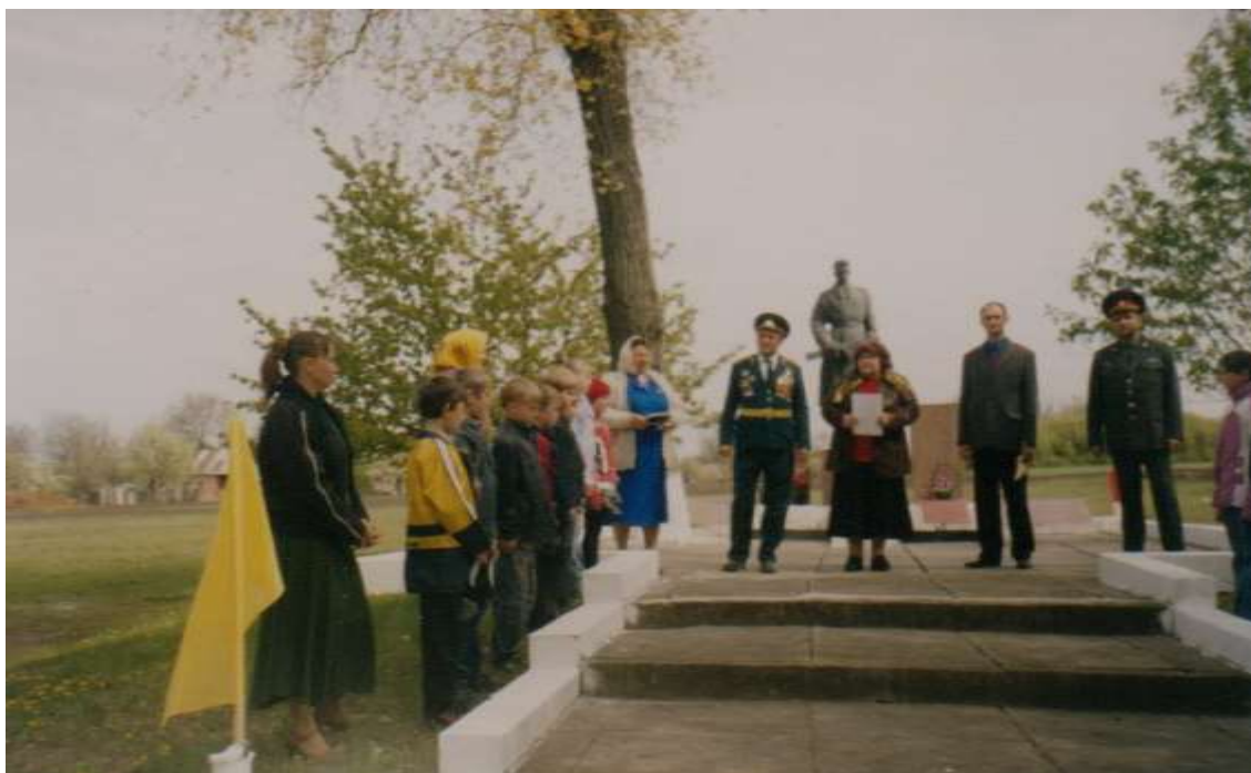
( Біля пам'ятника)

Соціальний комплекс складає крім освіти, культура, медицина. На території села працюють три торгові точки, пошта, фельдшерсько – акушерський пункт, бібліотека, сільський клуб. Останні дві одиниці проводять велику культурно – масову роботу серед населення. Це і вечори відпочинку, зустрічі з видатними