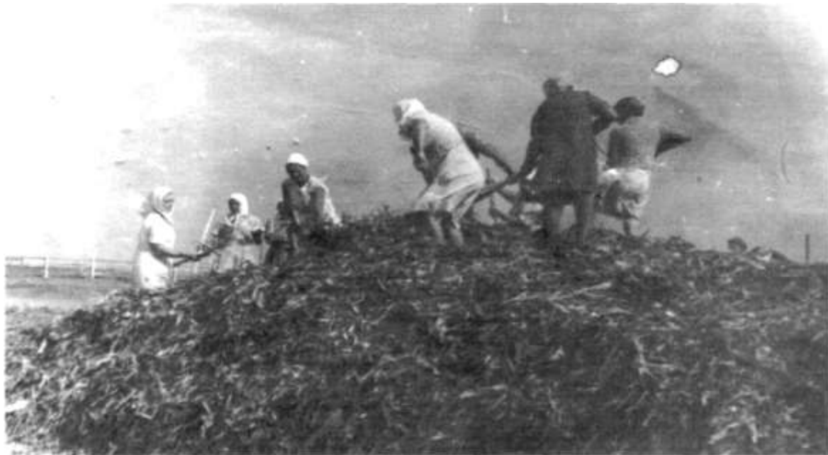
( На заготівлі кормів для громадської худоби )

Тоді в населеному пункті широко велось будівництво соціально— культурних об'єктів, доріг з твердим покриттям, виробничих споруд. Землероби одержували високі врожаї зернових і технічних культур. За його головування колгосп „ став на міцні” ноги швидко і впевнено , став мільйонером і вибором районний перехідний Червоний прапор та грошову премію. Було прокладено бруківку по селу і до траси Долинська - Кропивницький, збудовано нову високомеханізовану молочно – товарну ферму.