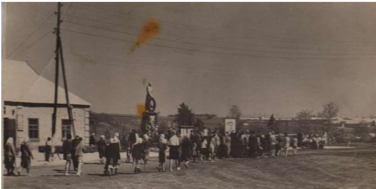
(9 Травня 1987 року)

12 березня 1944 року село було звільнено. Щороку 9 – го Травня жителі села збираються біля пам'ятника всим селом, щоб віддати шану рідним та близьким. Тут же сплять вічним сном воїни з обслугою санітарного обозу, якого розстріляв ворожий літак неподалік села.