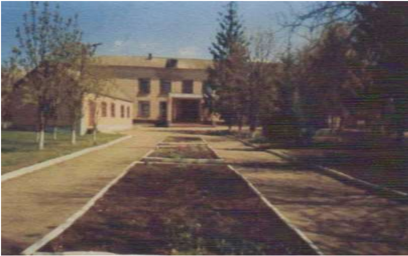
(Суходільська загальноосвітня школа I – II ступенів)

Школа обладнана сучасним стилем, є комп'ютерний клас, великий спортивний зал, майстерня, їдальня, красиві світлі класи, історичний музей. Педагогічний колектив налічує 10 вчителів. Всі мають вищу освіту, два вчителі вищу кваліфікаційну категорію, один звання „Старший вчитель”. Вся виховна робота направлена на виховання підростаючого покоління в душі любові до своєї країни, рідного краю. Різними формами роботи вчителі формують в дітей інтерес до навчання, народних ремесел, охорони довкілля, створення зелених куточків, проведення днів здоров'я, туристичних свят, екскурсій до інших міст. Випускники школи працюють у рідних стінах.