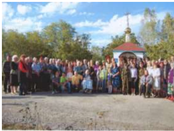
Святкування День села Дубровине