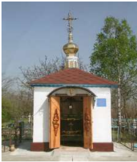
Капличка, збудована в 2012 році в селі Дубровине