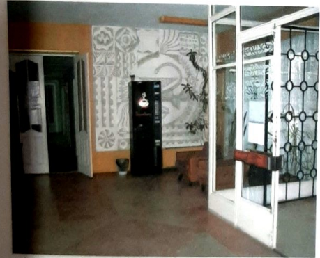
5-6. Фрагменти інтер'єру холу першого поверху будівлі поліклініки