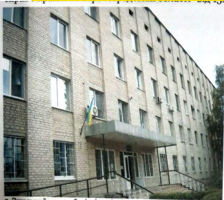
3. Загальний вигляд будівлі поліклініки. Вид з вулиці Волкова

Частина приміщення холу площею 1,0 кв.м, що знаходиться на першому поверсі будівлі поліклініки