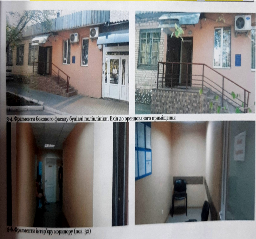
3-4. Фрагменти бокового фасаду будівлі поліклініки. Вхід до орендованого приміщення