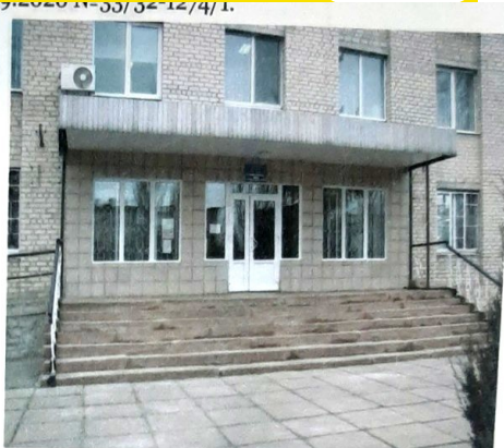
4. Фрагмент головного фасаду будівлі поліклініки. Головний вхід.